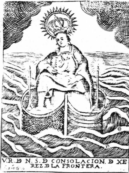
VR. B N. S. D. CONSOLACION. D. XE REZ. B LA FRONTERA.