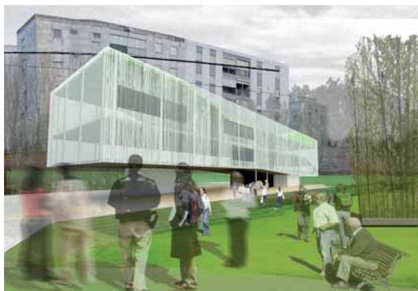
Infografía del Centro Integral para la Infancia

5º Poner en valor el paisaje urbano con actuaciones en su medio ambiente, constituyendo la urbanización de la zona verde de Santo Tomás el prima actuación del Plan Urban.