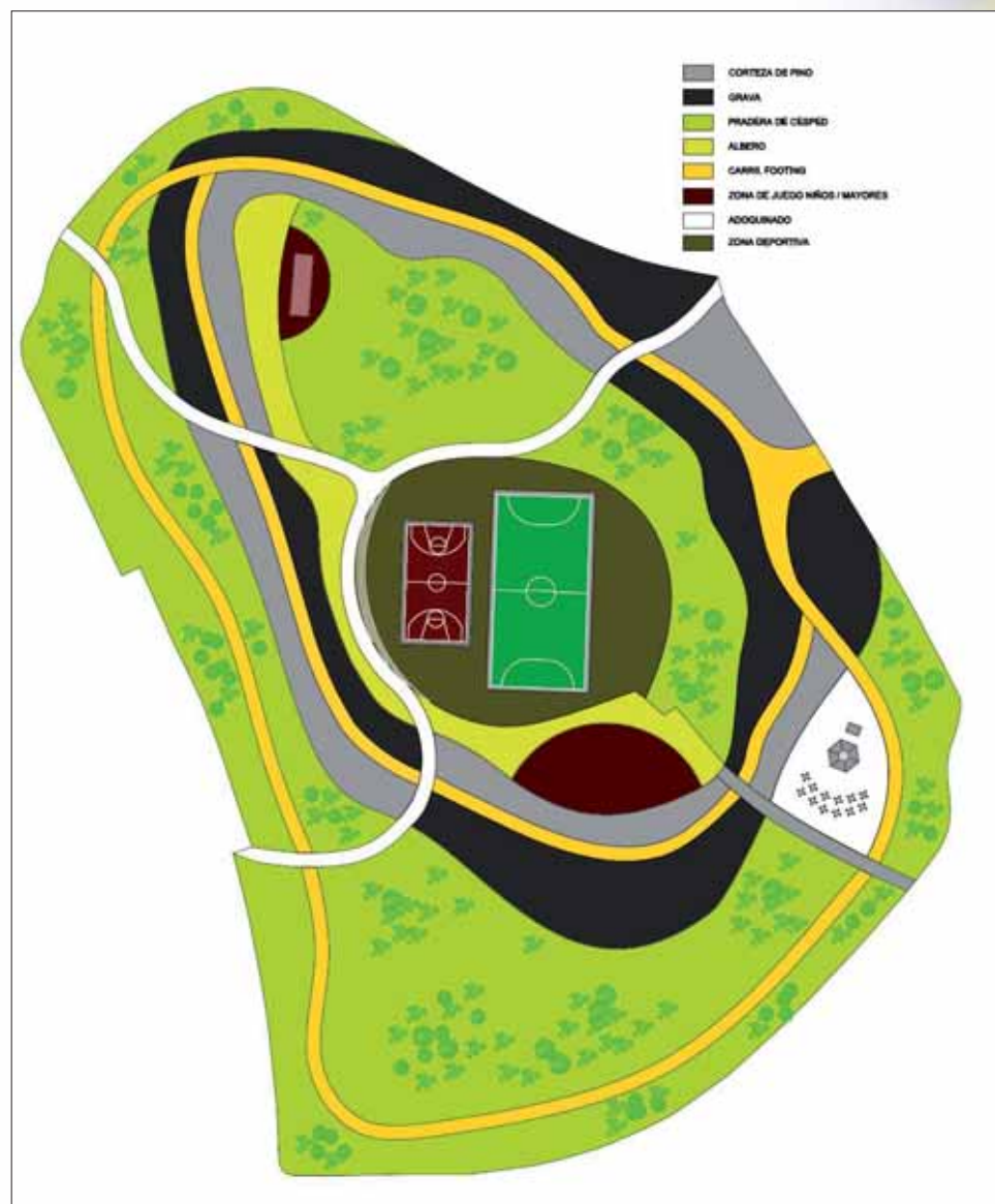
Plano del cerro de Santo Tomás