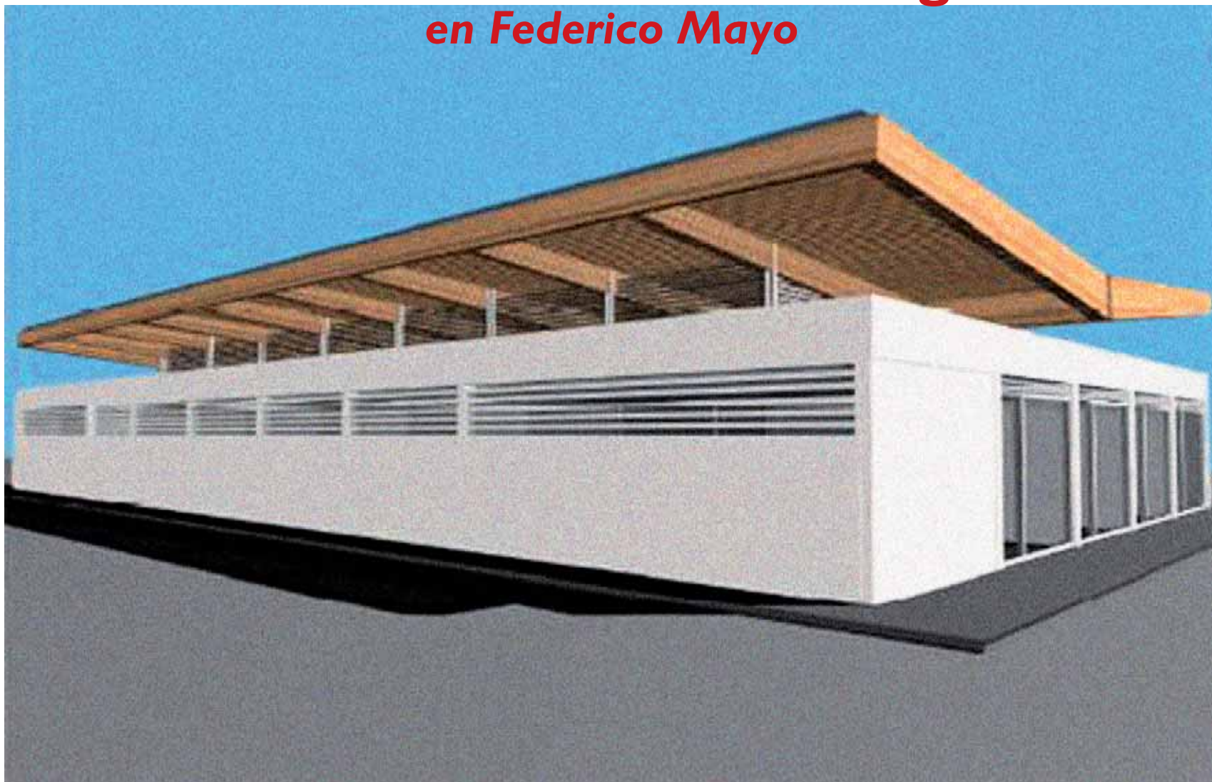
Infografía del nuevo mercado de abastos de Federico Mayo

Uno de los objetivos del Plan Iniciativa Urbana es el de mejorar el comercio de proximidad como motor de reactivación social y económica local. Por ello, dentro de la revitalización del comercio de proximidad de la Zona Sur, se ejecutará las obras para el nuevo Mercado de Federico Mayo cuya reconstrucción supone una inversión de 700.000 euros.