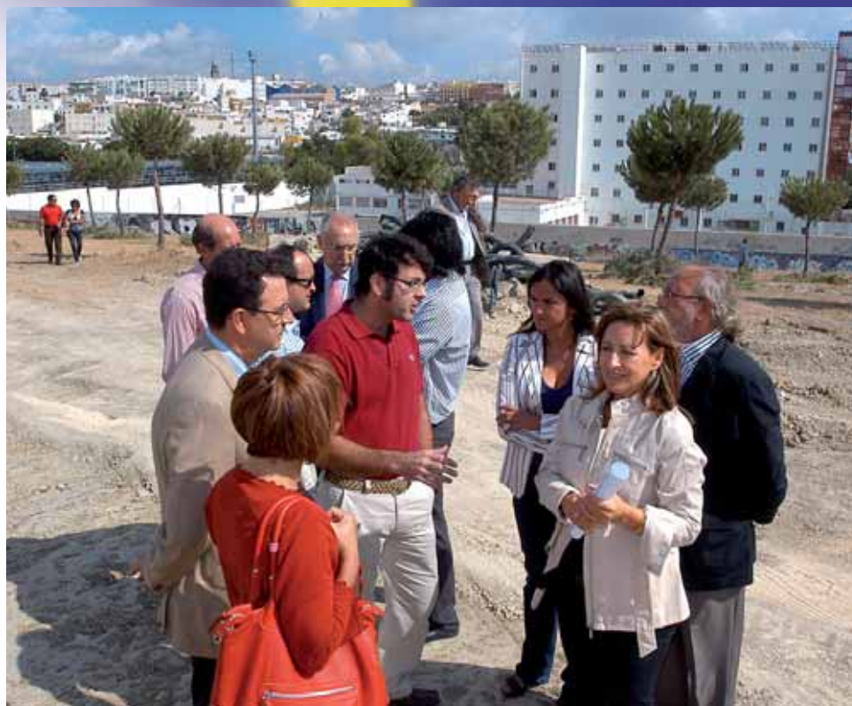
Foto inicio obra cerro de Santo Tomás

Para entrenamiento de los aficionados a este popular juego.