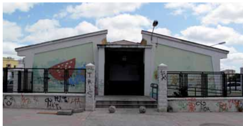
Estado actual del mercado de abastos de Federico Mayo

El nuevo mercado de Federico Mayo se plantea como una sustitución integral del anterior con el objeto de mantener la actividad en condiciones acordes a las exigencias en cuanto a las normativas higiénico-sanitarias y constructivas actuales. Será una edificación de nueva planta, de entre 500 y 550 metros cuadrados, con una distribución similar a la del mercado actual, si bien, se ampliarán los espacios de circulación, y se incluirían todos los servicios complementarios (aseos, vestuarios, instalaciones, etc.). Como sistema constructivo, se opta por una estructura de madera laminada, que permite crear un gran espacio diáfano, sin necesidad de disponer pilares intermedios, y que por sus características, dotan de un aspecto bastante acogedor al interior.