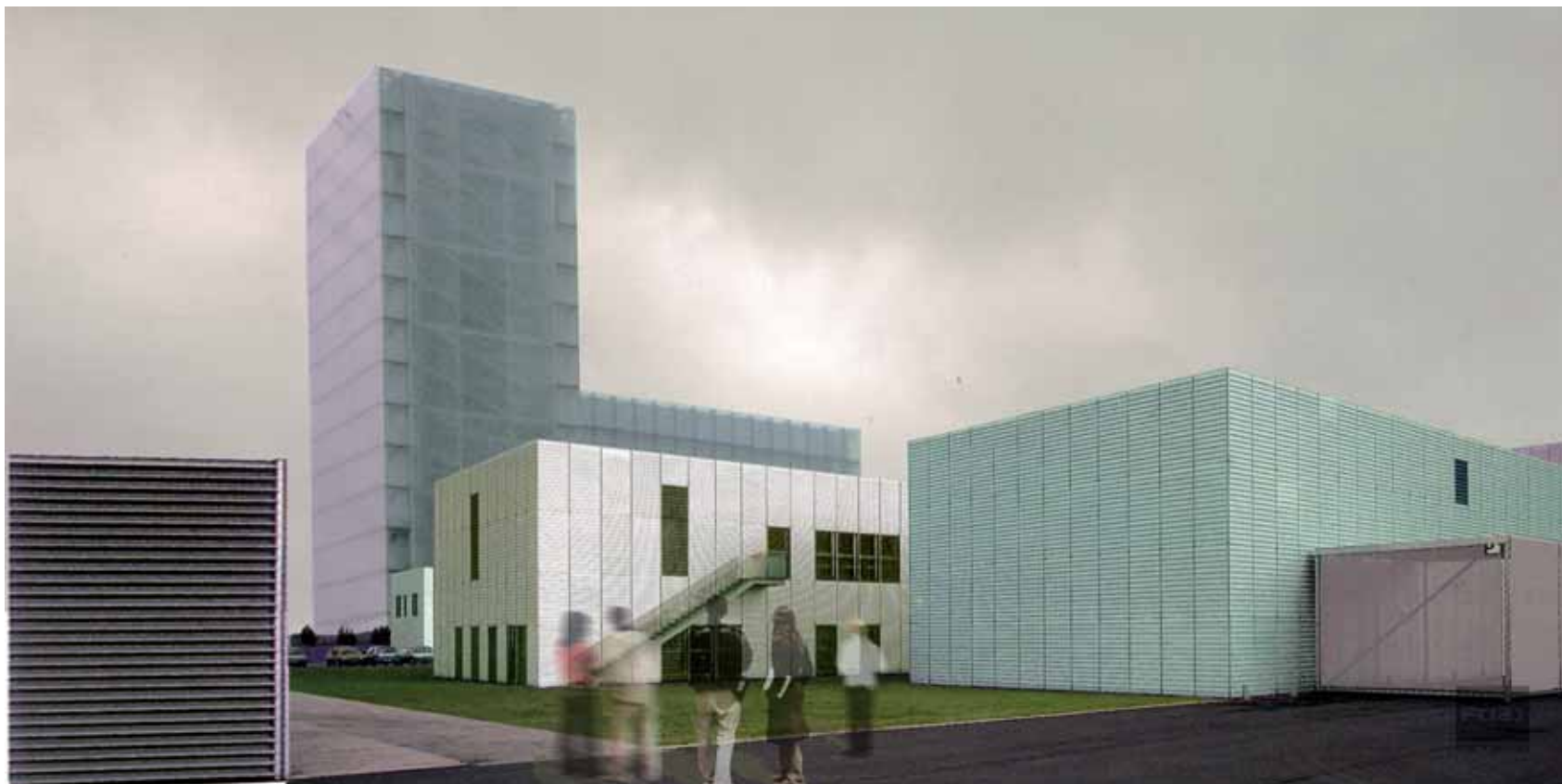
Infografía de la zona empresarial en el acceso al Portal