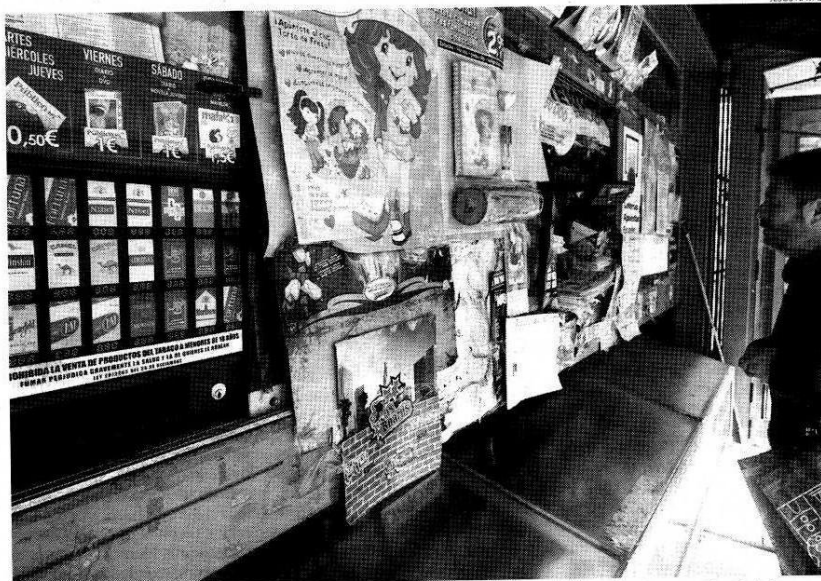
La antigua norma permitía en algunos casos la instalación de máquinas dispensadoras de paquetes de tabaco.

Antes de llevar la nueva norma a la práctica, "la estudiamos con total detenimiento, porque por comas o puntos, las cosas podían cambiar mucho, y ya tuvimos problemas la última vez cuando a algunos establecimientos se les permitió instalar máquinas dispensadoras de tabaco", insistía Juan