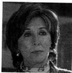
CONCHA VELASCO ACTRIZ