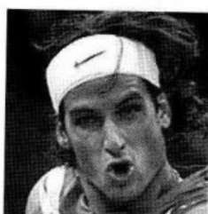
FELICIANO LÓPEZ TENISTA

La actriz Concha Velasco recibe hoy la Medalla de Honor del Círculo de Escritores Cinematográficos por toda su carrera. Además también se darán los premios CEC a la mejor película del año