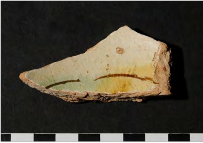
Graffita arcaica tirrenica . Palacio Riquelme

La otra, es un pequeño fragmento de una escudilla vidriada en blanco amarillento y decorada con dos incisiones semicirculares que dejan ver la pasta de fondo, enriquecida con pinceladas en verde y amarillo. Pertenece al tipo conocido como graffita arcaica tirrenica que se desarrolla desde la segunda mitad del siglo XII hasta el siglo XV, uno de cuyos centros productores es precisamente Savona (Varaldo, C.; 1997). Este ejemplar apareció en la intervención arqueológica de apoyo a la restauración del palacio Riquelme, asociado a otros materiales, como cerámica verde y manganeso valenciana y la serie verde sobre blanco, que se encuadran entre fines del siglo XIV y principios del XV.