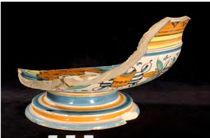
Perfil de la pieza

La forma acampanada con ancho pie moldurado y labio exvasado a partir de una carena, es característica de las manufacturas de este centro de producción, y estaría llamado a tener un gran éxito, siendo imitada posteriormente por otros centros alfareros italianos.