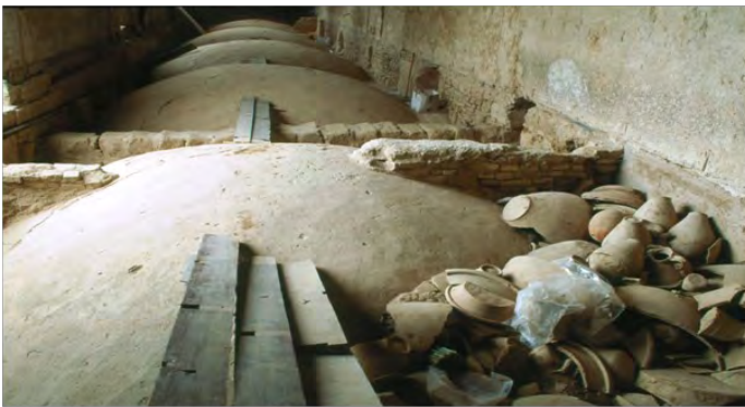
Bóvedas del claustro de Santo Domingo. Lugar del hallazgo

Fue hallado en 1999, durante los trabajos de consolidación de las bóvedas del claustro de procesiones del convento de Santo Domingo, concretamente en la galería que corre paralela al cuerpo de la iglesia. Se encontraba formando parte del relleno de descarga de las bóvedas (loza quebrada) (Barrionuevo, F.; 2009).