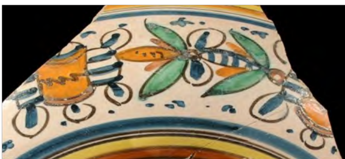
Decoración a tamburi

y para diferenciarlo de otro tipo de motivos, deco- ro a tamburi (decoración de tambores).