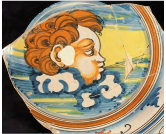
Emblema central figurado con la representación de Eolo o uno de los vientos

por sutiles líneas en marrón de manganeso sobre una banda naranja.