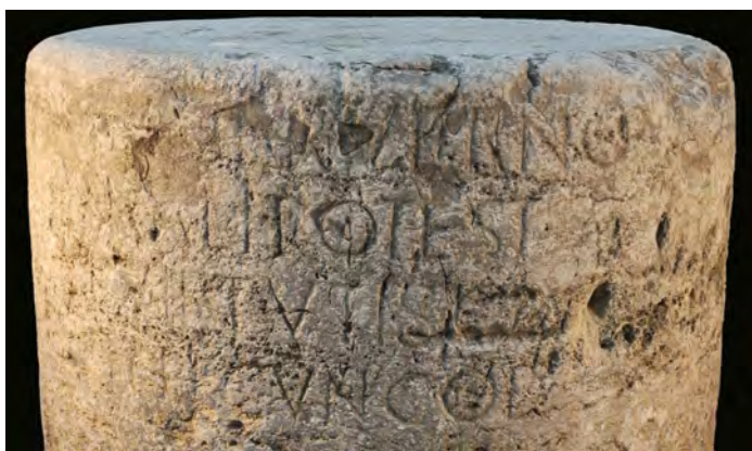
Fig. 3. Detalle de la inscripción de Verno

J. González 11 en su repertorio epigráfico de la provincia de Cádiz sigue la interpretación de Hübner, restituyendo [L(ucio) Titio L(uci) f(ilio)] Ser(gia tribu) Verno / [aedili (duum)] virali potest(ati) / honoris et virtutis cau[sa] / [de]cur(ionum) d(ecreto) de pecun(ia) col(lata) 12 .