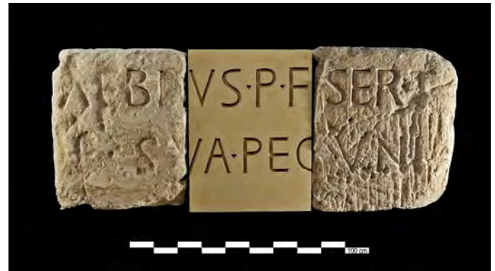
Fig. 8. Dintel monumental de Baebius ( Hasta Regia , Mesas de Asta, Jerez)

La segunda expresión de este florecimiento de Hasta Regia la constituyen las múltiples tegulae procedentes de aquel yacimiento arqueológico con la mención del Leg(atus) pro pr(aetore) de la provincia M. Petrucidius M(arci) f(ilius) . Este Marco Petrucidio es, por ahora, el más antiguo Legado con potestad pretoria de la Bética conocido para la época