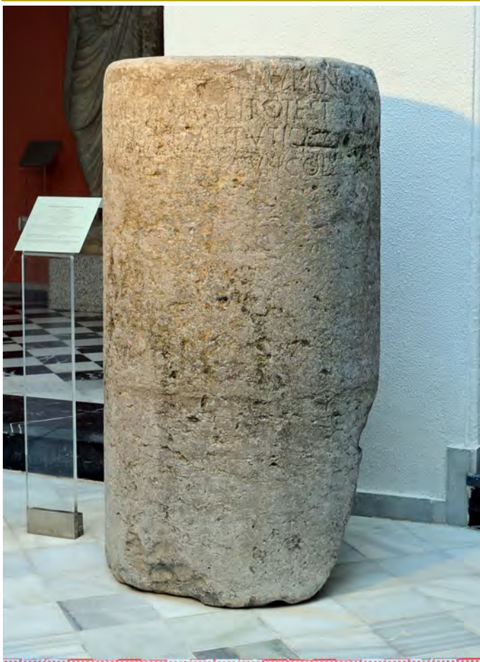
Fig. 2. Pedestal cilíndrico de Verno. Altura: 123 cm

.....F....VIRALI·POTEST· / HONORIS ·T VIRTVTIS CAV... / ....CVR D·DI·PECVN·COL. Más adelante, a comienzos del siglo XIX, Antonio Mateos Murillo presentó un informe a la misma Real Academia de la Historia dando cuenta de la existencia de ésta y otras inscripciones jerezanas 6 .