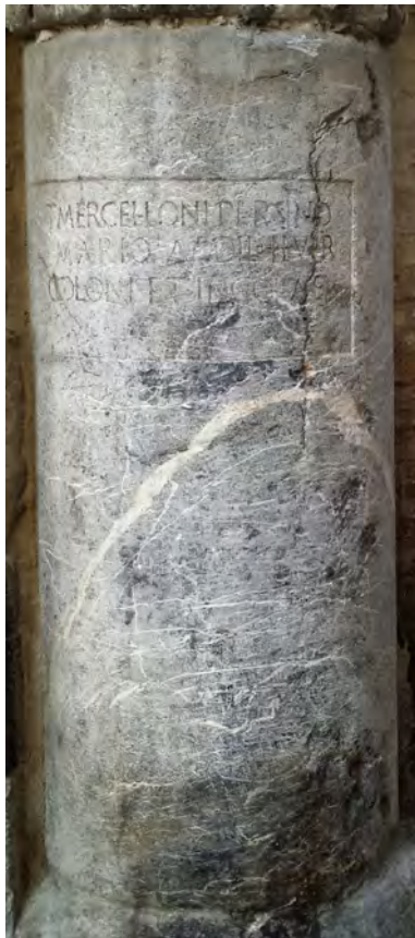
Fig. 4. Pedestal del edil y duoviro T. Mercello Persinus Marius (Córdoba; CIL II 2 /7, 311). Altura: 104 cm