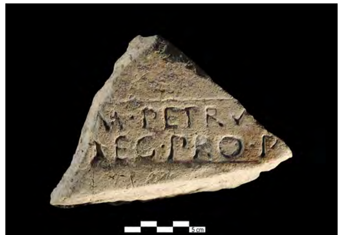
Fig. 9. Tégula de M. Petrucidius ( Hasta Regia . Mesas de Asta, Jerez)

posterior a la conclusión de la Guerra Civil 23 . Las innumerables tegulae en que aparece su nombre en nominativo documentan el resultado de su función como alto promagistrado, sólo subordinado al proconsul provinciae , volcado en la obligada efervescencia edilicia de la época, resultado del proceso colonizador, que exigía, por prescripción legal, la consolidación o renovación del caserío, e ideológicamente propiciaba la monumentalización urbana. Estas tegulae han aparecido en gran número, además de en Hasta Regia 24 , en