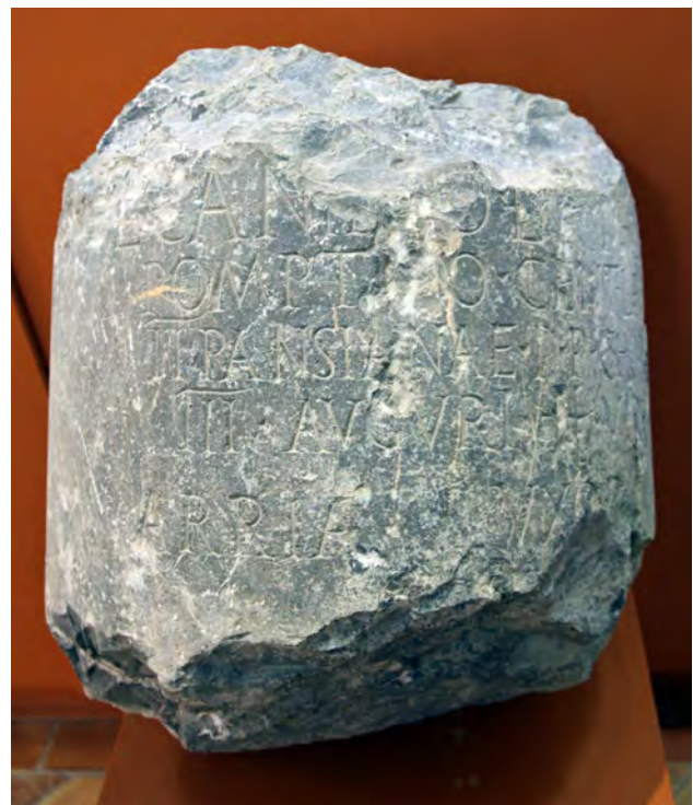
Fig. 7. Pedestal del duoviro L. Caninius Pomptin[us] (Écija; HEp 11, 457 = HEp 14, 316 = AE 2001, 818). Altura: 60 cm