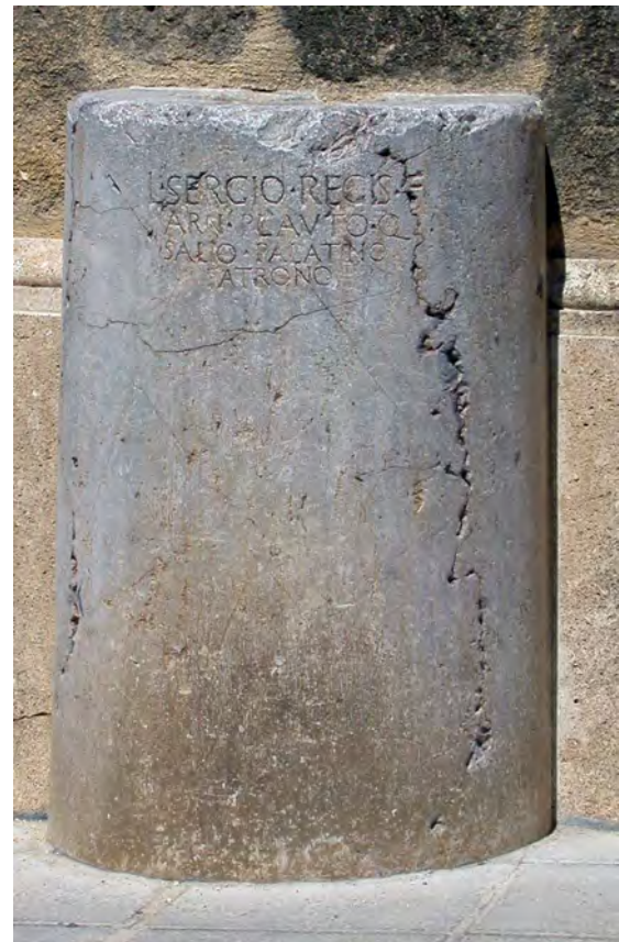
Fig. 5. Pedestal del senador romano L. Sergius Plautus (Osuna; CIL II 2 /5, 1113). Altura: 102 cm