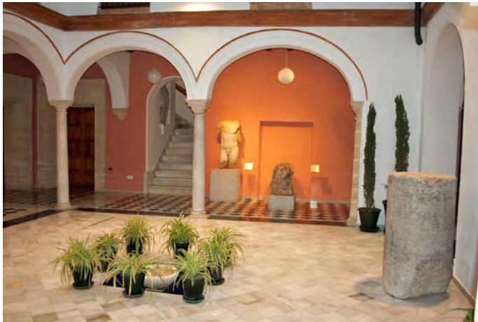
Fig. 1. Patio de acceso al Museo Arqueológico de Jerez

En el patio central del primitivo palacio de fines del siglo XVIII que constituye el núcleo inicial de la actual sede del Museo Arqueológico de Jerez, evidencia de la extraordinaria riqueza patrimonial de esta ciudad, se exhibe un fuste marmóreo que, a pesar de su significación histórica, no es habitual foco de interés frente a la majestuosidad formal de otras piezas de la colección. Este fuste contiene una inscripción romana que suele pasar desapercibida, cuya descripción me dará pie para tratar de la procedencia de la pieza, su contexto histórico y su funcionalidad, ad maiorem gloriam Hastensium ubi hodie Jerez est .