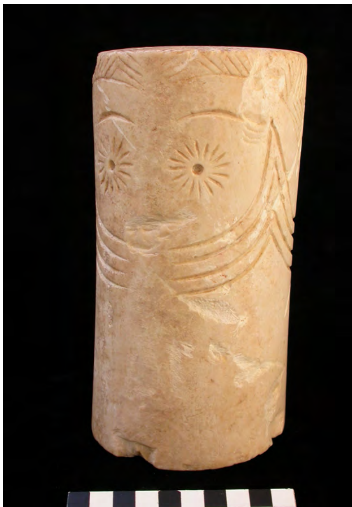
Ídolo de Torrejera ( Jerez de la Fra.). Tipo 4. Museo Jerez

Los “ídolos oculados” corresponden cronológicamente