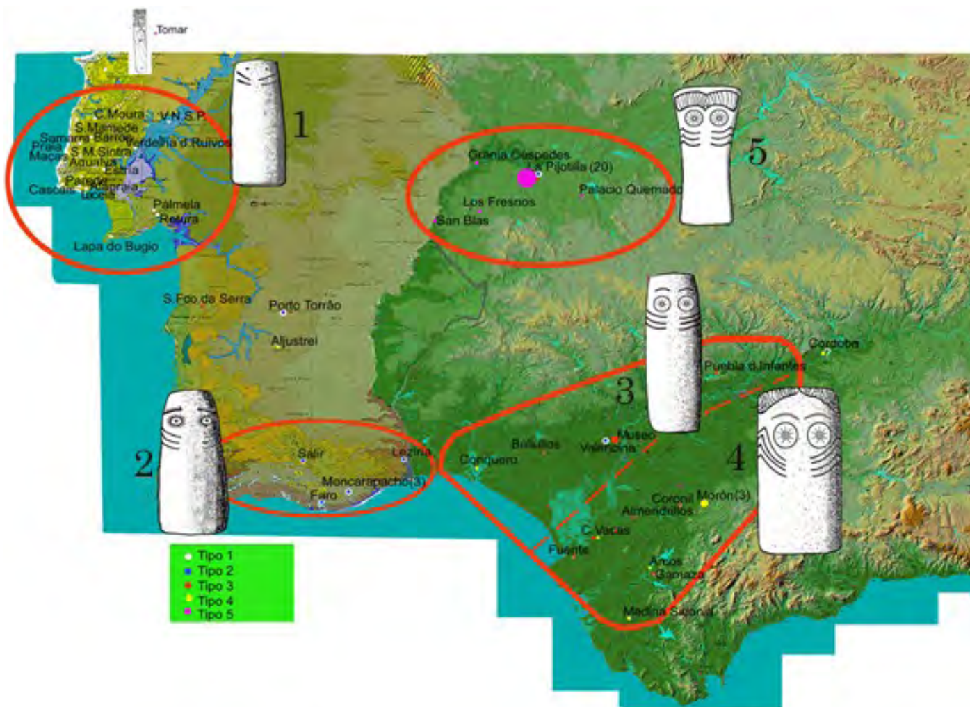
Distribución de las variantes de ídolos oculados en el Suroeste Peninsular.

precisas, existen numerosos tipos de representaciones simbólicas, diferentes manifestaciones estilísticas y una variada distribución geográfica.