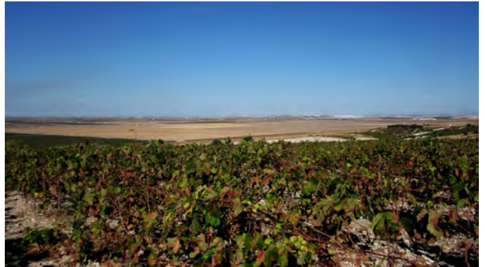
Cerro de las Vacas. Vista hacia el norte. Al fondo Lebrija

Poco sabemos del contexto en que fue hallada la pieza, solo se dice que apareció en el Cerro de las Vacas, un lugar que no ha sido excavado hasta hoy, aunque podemos considerarlo como asentamiento, por lo que estaría relacionada más con un contexto habitacional que funerario.