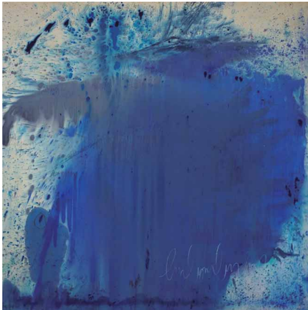
S/T Acrílico/lienzo 200 x 200 cm • 2025