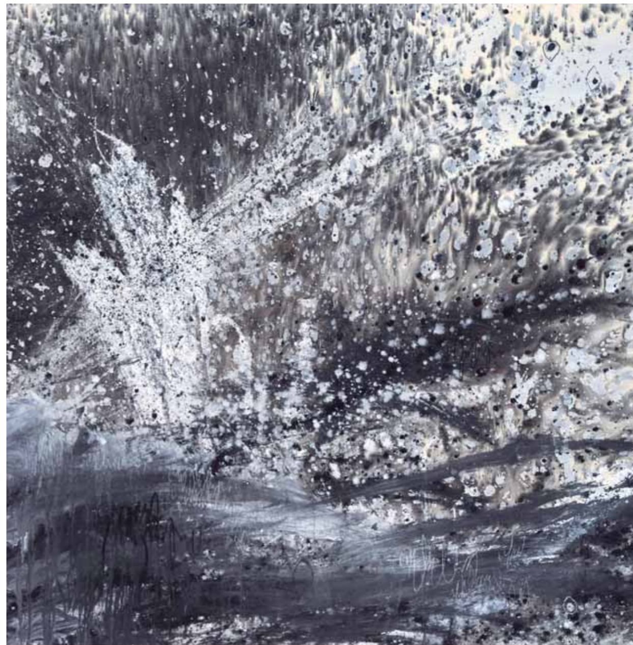
S/T Acrílico/lienzo 100 x 100 cm • 2025