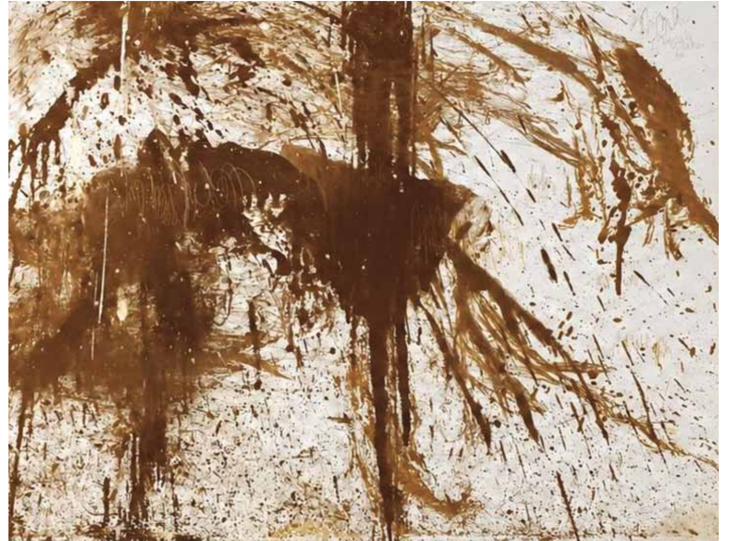
S/T Acrílico/lienzo 130 x 170 cm • 2026