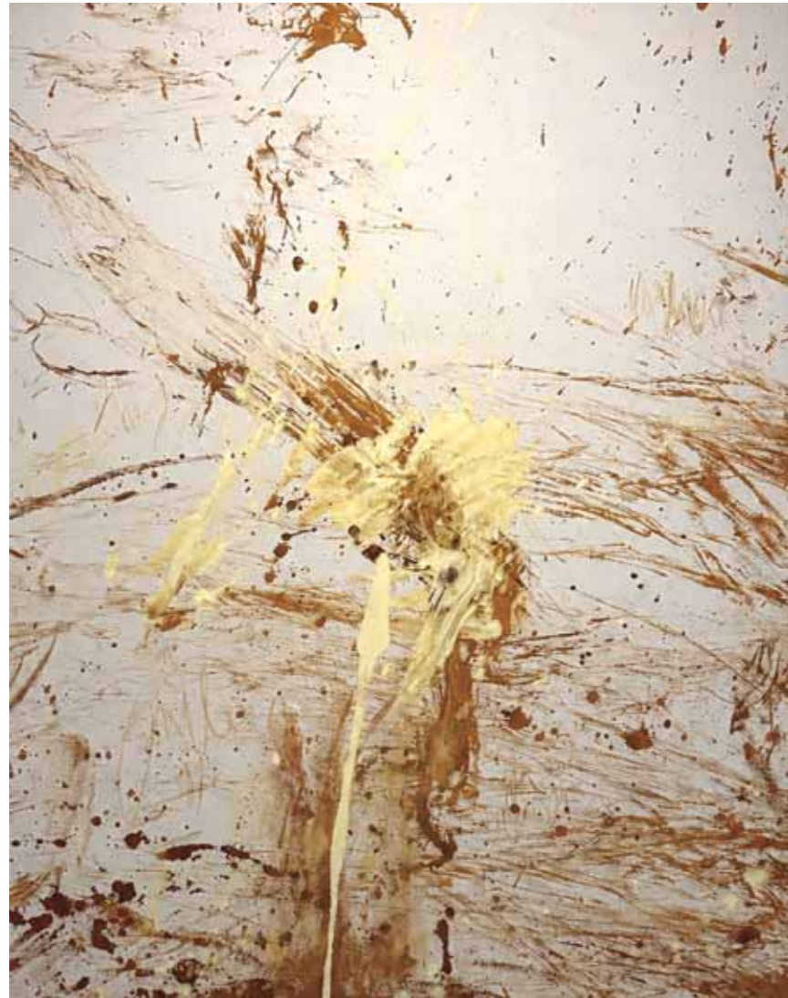
S/T Acrílico/lienzo 92 x 73 cm • 2026