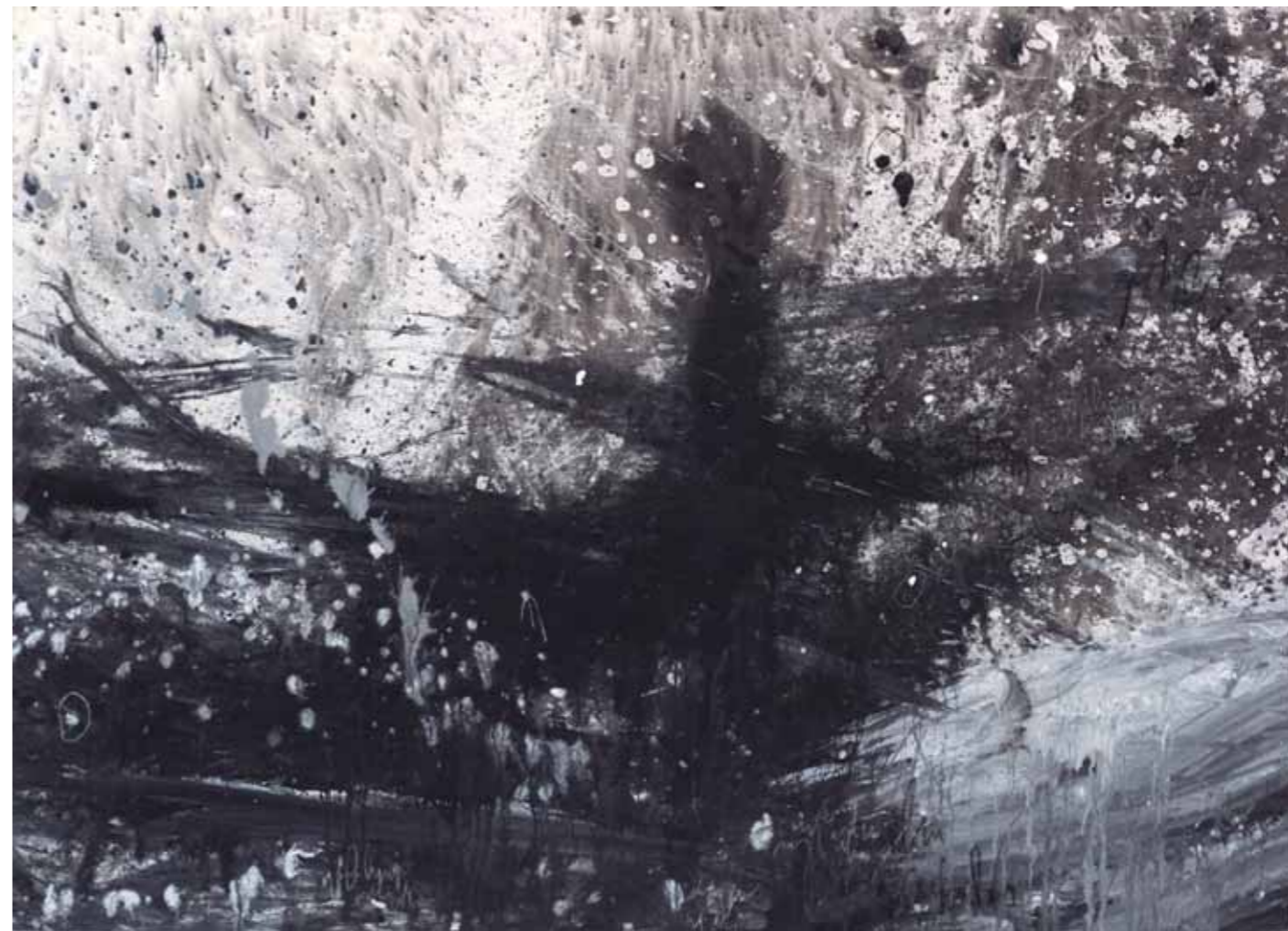
S/T Acrílico/lienzo 74 x 100 cm • 2025