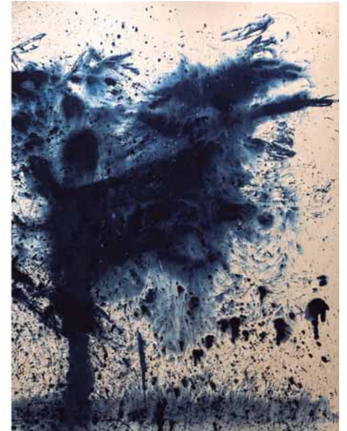
S/T Acrílico/lienzo Díptico 200 x 300 cm • 2026