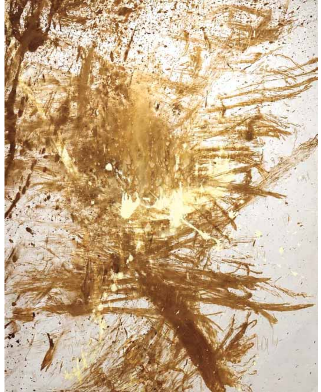
S/T Acrílico/lienzo 130 x 160 cm • 2026