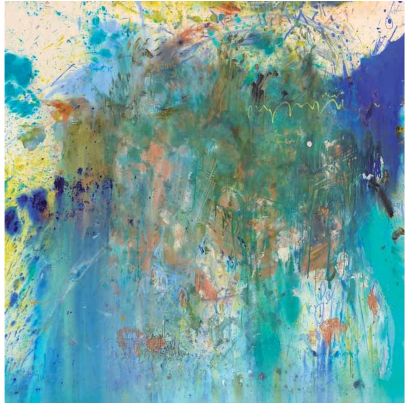
S/T Acrílico/lienzo 200 x 200 cm • 2024