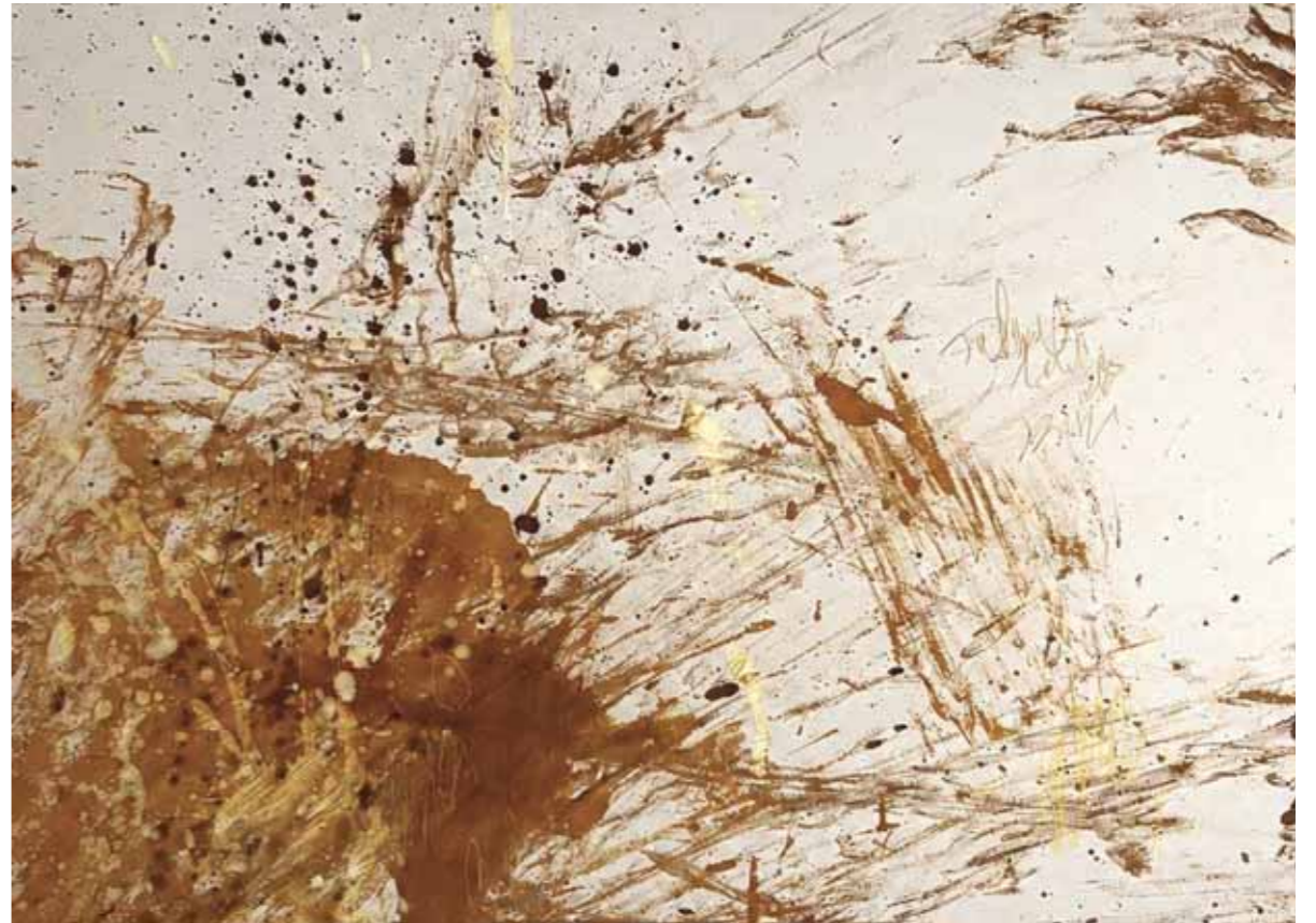
S/T Acrílico/lienzo 50 x 70 cm • 2026