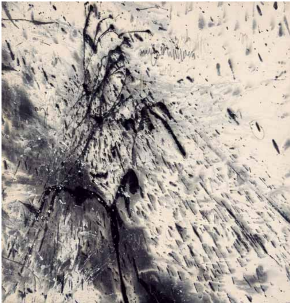
S/T Acrílico/lienzo 70 x 70 cm • 2025