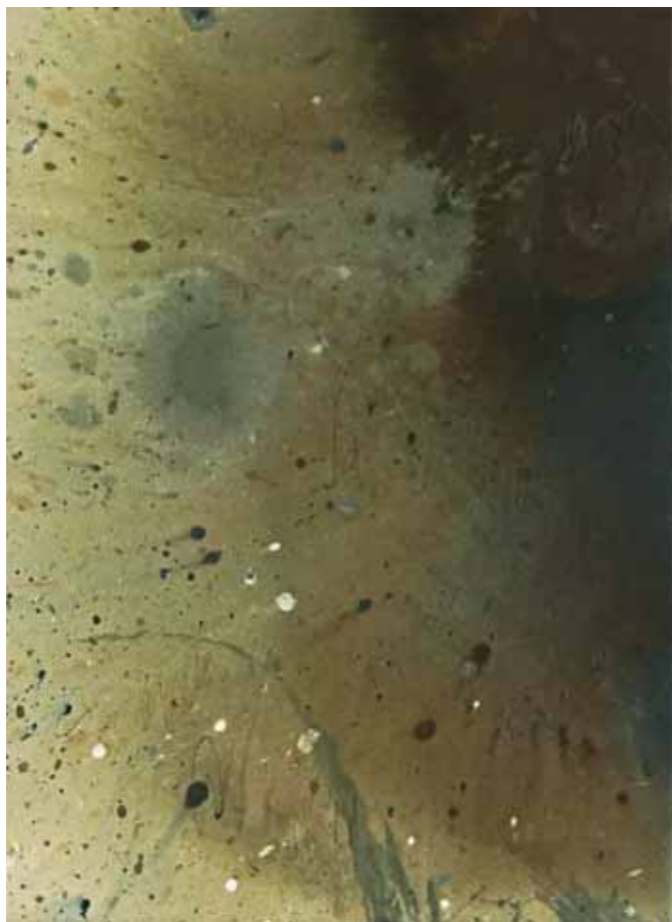
S/T Acrílico/lienzo 70 x 50 cm • 2025