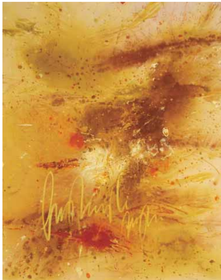
S/T Acrílico/lienzo 92 x 73 cm • 2026