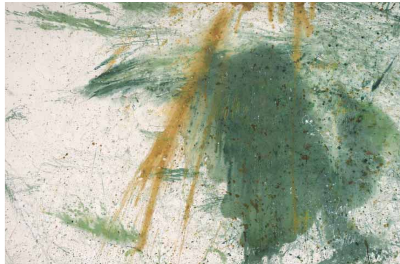
S/T Acrílico/lienzo 110 x 170 cm • 2025