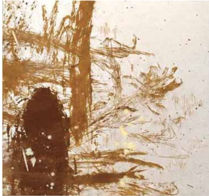
S/T Acrílico/lienzo 70 x 70 cm • 2026