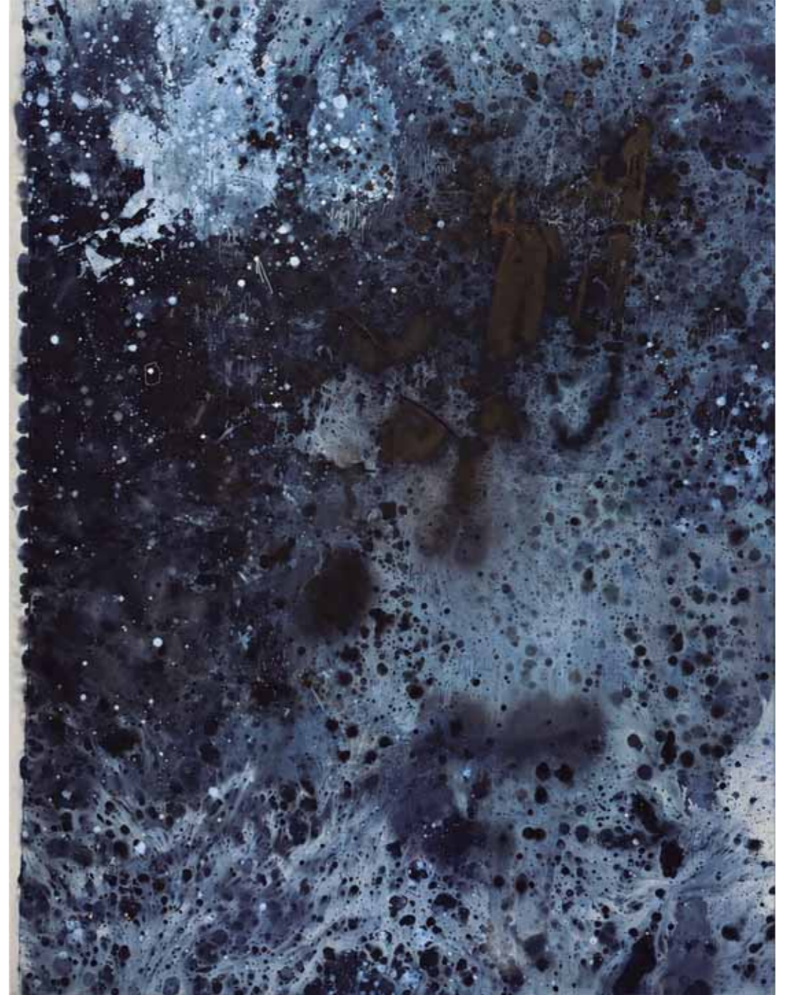
S/T Acrílico/lienzo 150 x 200 cm • 2026