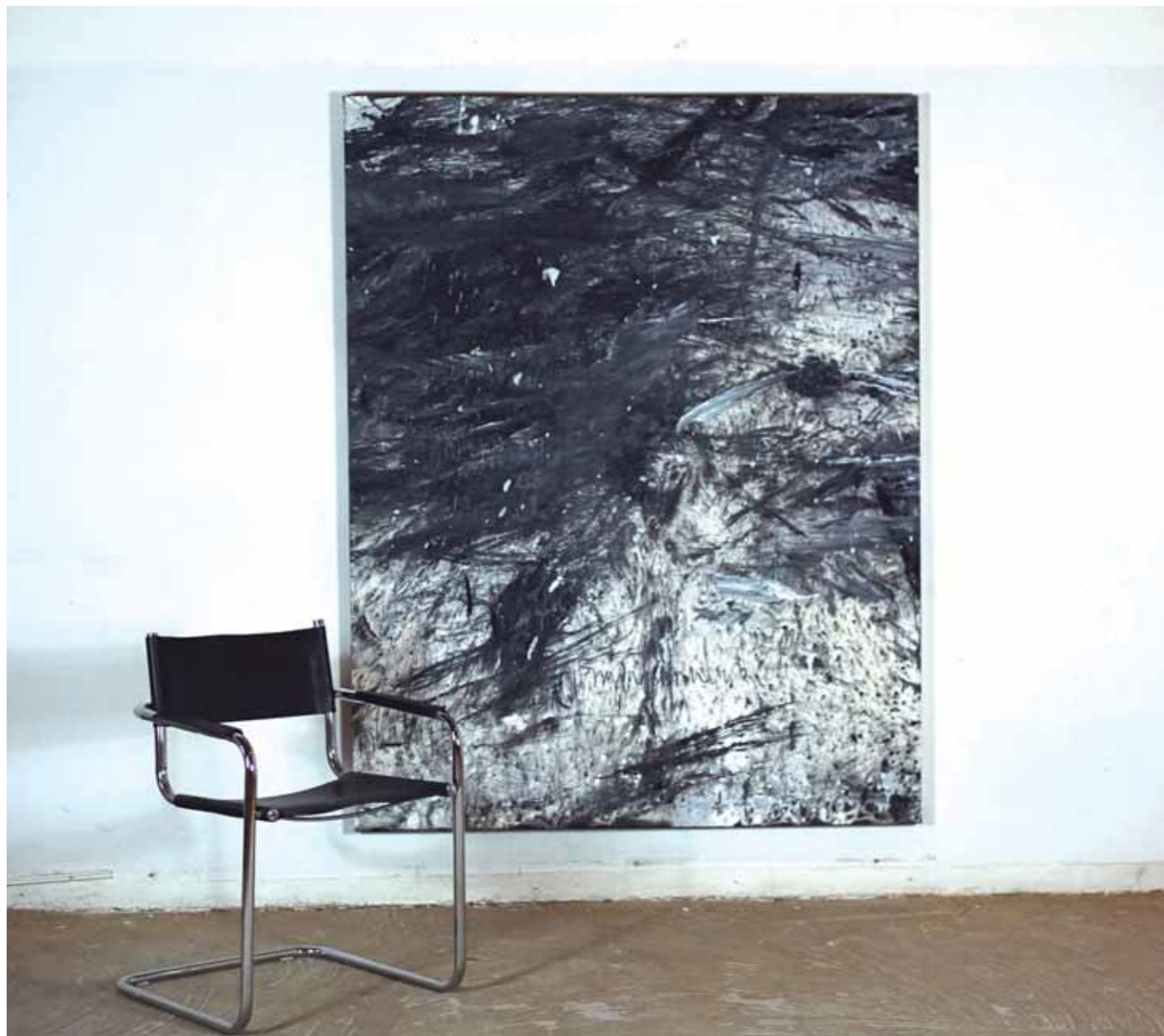
S/T Acrílico/lienzo 180 x 140 cm • 2025