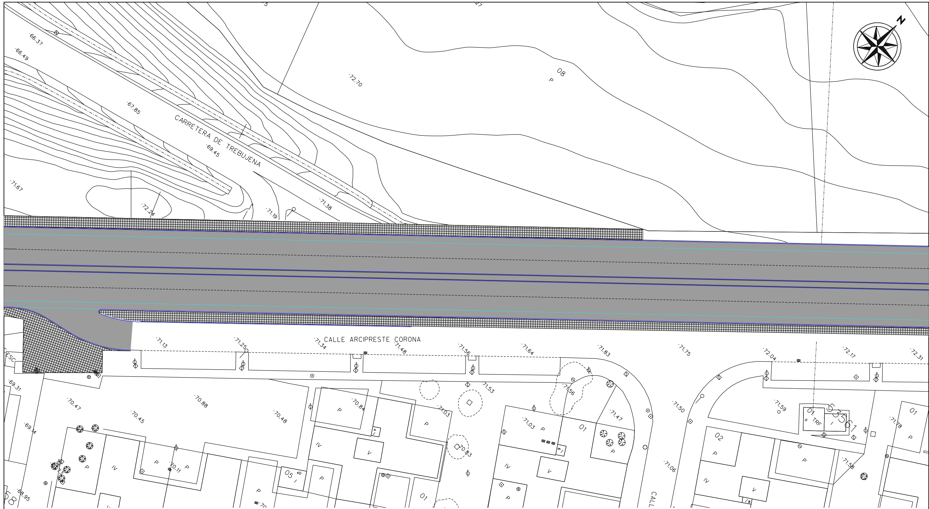
PLANTA GENERAL DE DISTRIBUCION DE HOJAS