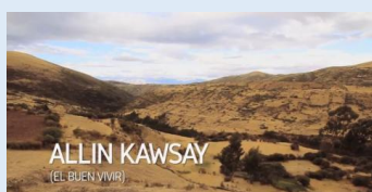
Buen Vivir en Perú