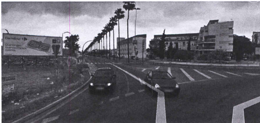
PUNTO "1" (AVDA PUERTAS DEL SUR)

El paso de dichos camiones, de forma continuada, está, aparte de deteriorando enormemente la calzada, desgastando prematuramente la pintura de la misma, y también provocando, en muchas ocasiones, por la velocidad que alcanzan dichos vehículos, lo que supone un absoluto peligro para los viandantes y ciclistas que, en gran número, y por tratarse de una zona altamente residencial y comercial, usan dicha Avenida para hacer sus compras, llevar a los niños a las actividades extraescolares, pasear tranquilamente o simplemente ir a tomar un café al bar más cercano.