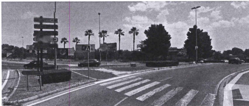
PUNTO "0" (AVDA PUERTAS DEL SUR)

Con esta iniciativa Ciudadanos Jerez (C's), quiere hacer referencia al uso de los casi dos kilómetros que tiene la Avenida Puertas del Sur, por parte de los vehículos de tracción mecánica, más concretamente en el caso de los camiones, que tienen una capacidad superior a los 3.500 Kgs. de peso, y que vulneran el artículo 77 de la Ordenanza Municipal de Circulación de nuestra ciudad, vinculada al Real Decreto Legislativo 6/2015, de 30 de octubre, por el que se aprueba el texto refundido de la Ley sobre Tráfico, Circulación de Vehículos a Motor y Seguridad Vial.