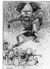
¿Todos los profesores son crueles?