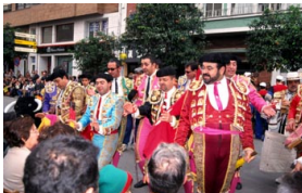
¿Todos los españoles son toreros, vividores y vagos?

Si no recuerdas qué es un estereotipo, consulta la definición que has realizado en la actividad anterior