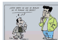
Ilustración del Cómic: ¿Racista Yo? Editado por la Comisión Europea. Autores: Sergio Salma y Mauricet. http://ec.europa.eu/publications/archives/young/01/txt_whatme_racist_es.pdf

GÉNERO: Existen prejuicios de género cuando valoramos más a los hombres que a las mujeres. Se presenta a las mujeres como inferiores física e intelectualmente y solamente preparadas para las tareas del hogar y el cuidado de ancianos, niños y enfermos.