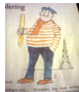
¿Los franceses son orgullosos?