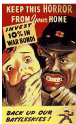
¿Los japoneses son fríos y despiadados?