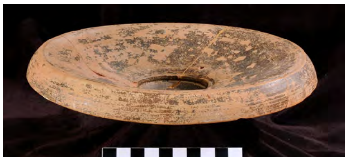
Plato de pescado “tipo Kuass”. Mesas de Asta. Campaña 1942-43

Entre este material tanto Esteve como el propio Ponsich (el descubridor de las cerámicas de Kuass) reconocieron en su momento la existencia de piezas que se correspondían formal y técnicamente con los ejemplares hallados en el yacimiento norteafricano de Kuass por el investigador francés. Revisiones posteriores han ratificado la existencia de cerámica de “tipo Kuass”, cuya presencia es habitual en el poblado, documentándose sobre todo las dos formas que