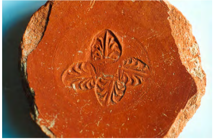
Fondo de vaso "tipo Kuass" con decoración estampillada

mediante la impresión de estampillas que representan palmetas y rosetas en el fondo interno de los vasos; generalmente con perfiles festoneados que se adaptan a los detalles de los motivos.