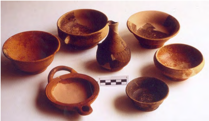
Diferentes piezas de la vajilla barnizada "tipo Kuass" procedentes del Castillo de Doña Blanca

Cuando hablamos de cerámica “tipo Kuass” nos referimos a la vajilla de corte helenístico fabricada por los talleres alfareros púnico-gaditanos que imita y/o se inspira en las formas áticas de Barniz Negro. Esta producción surge a finales del siglo IV a. C. y goza de un extraordinario éxito durante la siguiente centuria y los primeros decenios del s. II a. C. hasta que desaparece al no poder competir con las cerámicas itálicas campanienses.