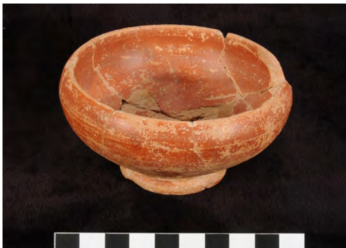
Cuenco “tipo Kuass”. Cerro Naranja . Los Garcíagos

En conclusión, del análisis de las piezas recuperadas en los núcleos de habitación y otros contextos de la campiña y marismas de Jerez,