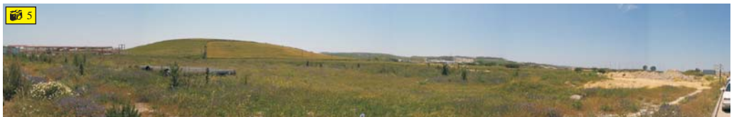
Vista desde la Avenida de Puertas del Sur de los terrenos donde se situará la 2ª fase de la Laguna de Torrox, con la Loma del Toruño a la izquierda.