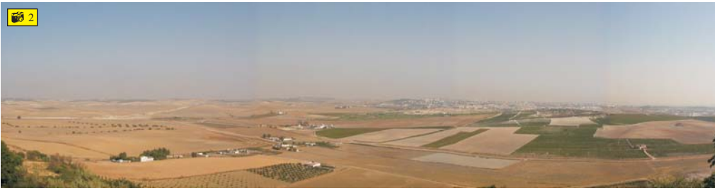
Vista desde la Sierra de San Cristobal donde se aprecia la Cañada del Carrillo hasta su intersección con la Ronda Oeste, en construcción, y la actual A-4 observándose el campo de golf en el centro.