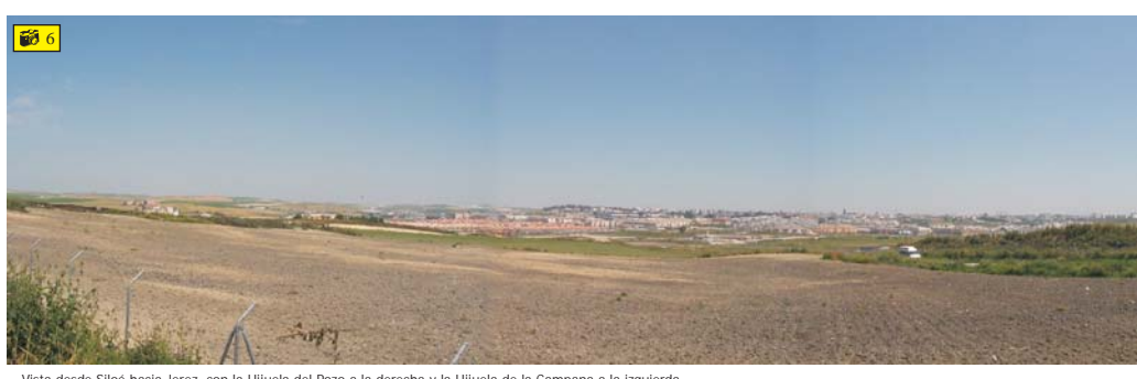
Vista desde Siloé hacia Jerez, con la Higuera del Pozo a la derecha y la Higuera de la Campana a la izquierda.