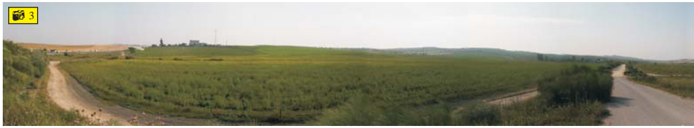
Vista de los terrenos entre la A-4 y la Cañada del Carrillo.