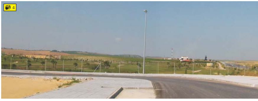
Vista desde Matacardillo del campo de golf y del Cerro de Matacardillo con la Carretera A-4 a la derecha.