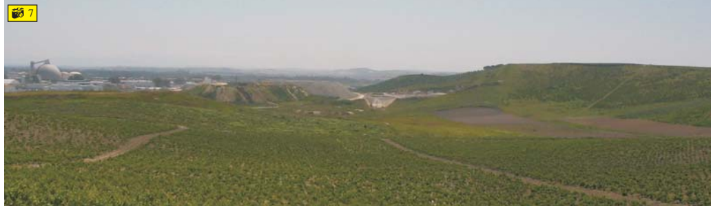
Vista desde la Higuera del Pozo hacia el Polígono Industrial El Portal.