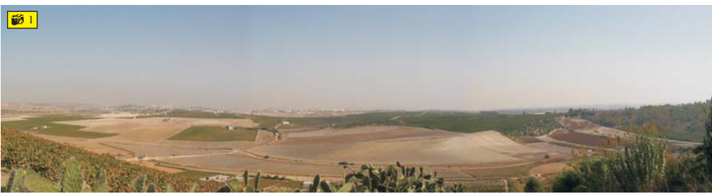
Vista desde la Sierra de San Cristobal de la Cañada del Carrillo con el Rancho de la Bola a la derecha.