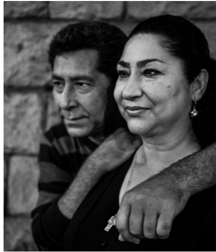
Los Toleo , 2013.

La primera referencia documental conocida que atestigua la llegada de los gitanos a la Península Ibérica es el salvoconducto expedido en 1425 por el rey Alfonso V de Aragón donde se hace referencia a un grupo de personas capitaneadas por “Don Juan de Egipto Menor”, exigiendo que sea “bien tratado y acogido”. Tras una historia ignominiosa de leyes represivas (desde la primera pragmática antigitana de 1499, firmada por los Reyes Católicos hasta la Ley de Vagos y Maleantes y el Reglamento de la Guardia Civil durante el franquismo) el devenir histórico de los gitanos ha conocido la opresión, el desprecio y la marginación. La Gran Redada, o Prisión General de Gitanos, persecución autorizada por Fernando VI en 1749 con el objetivo declarado de llevar a prisión a todos los gitanos del Reino, fue uno de sus máximos exponentes. La exposición recoge algunos de los documentos históricos más relevantes de los siglos XV al XVIII.