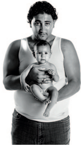
(PA) Maternidad . Serie Vidas Gitanas, 2011. Isabel Muñoz.

La historia de los gitanos españoles es también la historia de España y VIDASGITANAS transita por ella a través de un viaje compartido que para los visitantes gitanos significa una emotiva celebración identitaria. La exposición recorre la historia del Pueblo Gitano desde su llegada a España —procedentes del noroeste de la India en los albores del siglo XV— hasta nuestros días para reconocer y poner en valor las aportaciones romaníes a la cultura española, y combatir así unos estereotipos ancestrales que relegan a la minoría más antigua, más numerosa y más representativa de nuestro país a unos anquilosados tópicos de asistencialismo social o de folclore pintoresco que han venido perpetuado históricamente el desconocimiento y la desconsideración de su cultura.